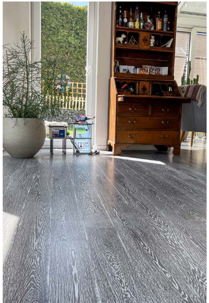
Auf rund 70 Quadratmeter wurde die Eiche Landhausdielen verlegt und zweifarbig gestaltet.