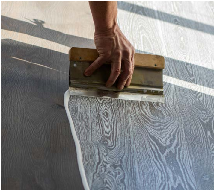
Durch den Auftrag der Farbspachtel PALL-X COLOR EFFECT setzen sich die Farbpigmente in den Vertiefungen des gebürsteten Bodens ab und erzielen den einmaligen Effekt, der den Dielenboden zum Unikat macht.