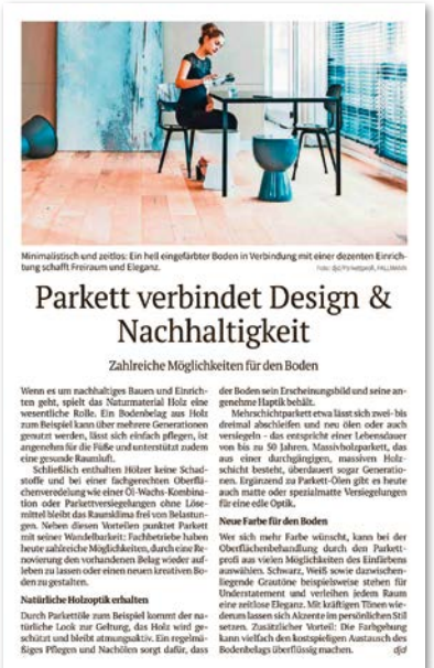
Neue Presse Coburg, August 2022