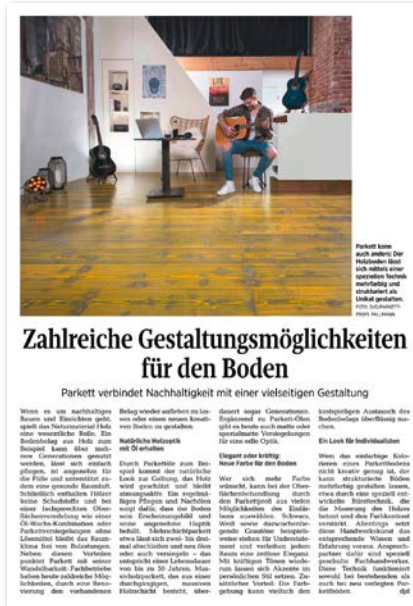
Kieler Nachrichten, August 2022

„Wir sprechen mit den Print-Kampagnen seit Jahren eine große Leserschaft an und werden auch in diesem Jahr diese klassische Werbeform nutzen, um die Attraktivität und Vorteile von Parkettböden ins Bewusstsein der Endverbraucher zu tragen.“, so Michael Röster von Parkettprofi. „Auf Anfrage erhalten unsere Parkettprofi Mitglieder von uns gerne bestehende Texte und passendes Bildmaterial, um ihrerseits das Thema weiter nach außen zu tragen.“ Parkettprofi setzt somit auf die Multiplikationswirkung durch die rund 360 Mitgliedsbetriebe, um Parkettböden beim Endverbraucher den Stellenwert zu geben, den sie verdienen: Ein hochwertiger, Naturboden mit zahlreichen Gestaltungsmöglichkeiten.