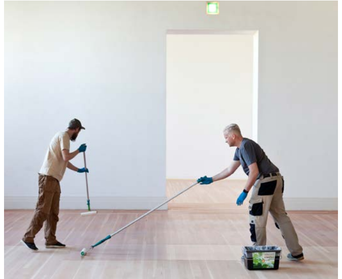
Nach dem Schleifen konnte der Parkettboden grundiert und in mehreren Schichten neu versiegelt werden.

Robert Mutschall zeigte sich nach Abschluss der Arbeiten mehr als zufrieden: „Ein solch namhaftes Objekt hat für uns natürlich einen besonderen Reiz. Gleichzeitig war es eine Herausforderung, die Fläche von knapp 2000 m 2 mit drei Parkettlegern zu stemmen. Ich bin sehr stolz darauf, dass