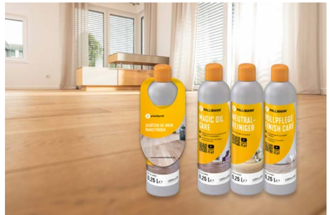
Diese Pflege- und Reinigungsmittel sind ab sofort wieder in der 0,25 Liter Flasche als Kundengeschenk im 20-er Karton erhältlich.

Die PALLMANN Produkte VOLLPFLEGE, MAGIC OIL CARE und NEUTRALREINIGER sind ab sofort als 0,25 Liter Flaschen im 20-er Karton inklusive Flaschenanhänger im Parkettprofi Portal erhältlich. Die kleinen Fläschchen können perfekt als Kundengeschenk genutzt werden. Zusammen mit der individualisierten Reinigungs- und Pflegeanweisung überreicht, bieten Sie dem Parkettprofi die Möglichkeit, die Kundenbindung an sein Unternehmen zu vertiefen.