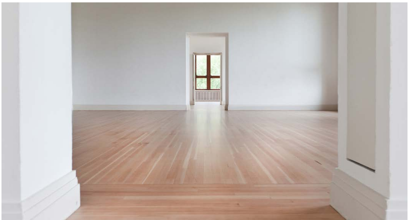
Der Douglasie Parkettboden erstrahlt in Rohholzoptik.

Die Parkettprofis der Rokett Berliner Holzböden GmbH mussten zunächst den alten Douglasie Parkett in vier Schleifgängen abschleifen.