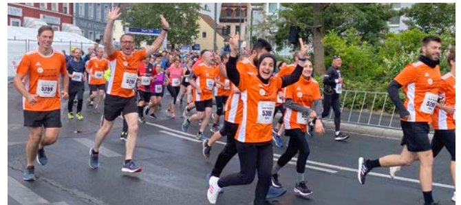
Alle Läuferinnen und Läufer genossen die gute Stimmung vor Ort und waren mit ihren Leistungen voll und ganz zufrieden.

Unter dem Motto „Gemeinsam läuft's“ sorgten die gutgeaunten Flitzer im orange farbigen Trikot für gute Stimmung und Aufsehen für die Marke Parkettprofi. „Nach unseren virtuellen Läufen in den letzten zwei Jahren, bei denen jeder für sich zuhause gelaufen ist, hat nun jeder einzelne die ausgelassene Stimmung und die positive Energie in der Gruppe mehr als genossen.“, so Michael Röster von Parkettprofi, der auch selbst wieder beim 21-Kilometerlauf am Start war. „Die Laufstrecke in Würzburg zählt nicht umsonst zu den schönsten und abwechslungsreichsten Marathonstrecken in Deutschland. Und bei uns bekommen die Läufer einen tollen Rundum-Service durch unser Helferteam, so dass sie sich ganz auf ihren Lauf konzentrieren können.“