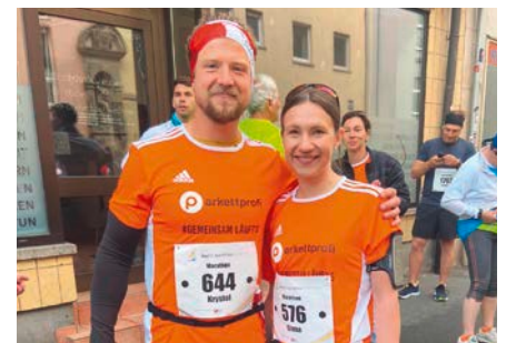
Zwei der Teilnehmer wagten sich an die Marathon Distanz von 42 km.