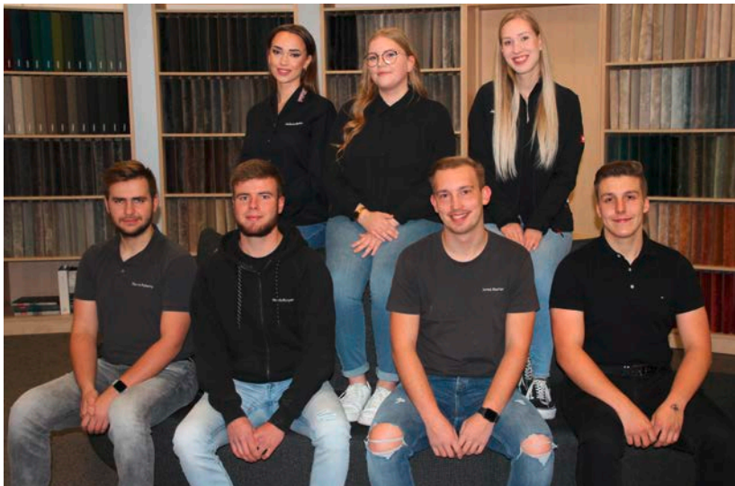
Ein junges Team: Das Bild zeigt die Auszubildenden der Fürst GmbH der vergangenen drei Jahre.