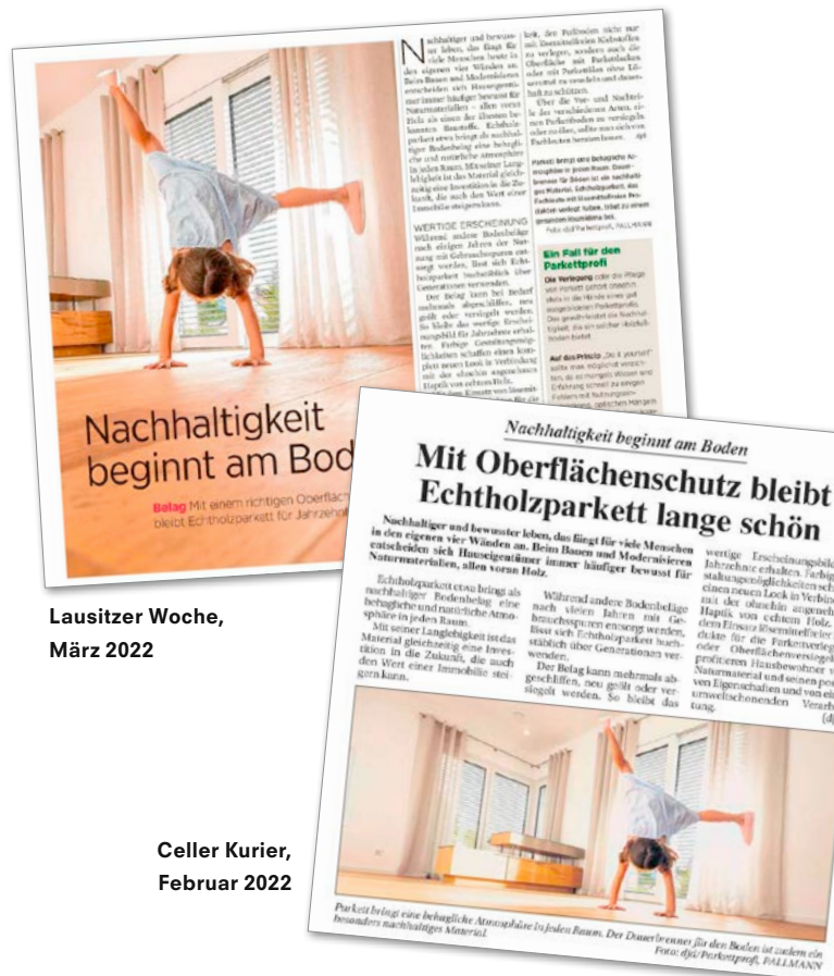
Lausitzer Woche, März 2022

Durch die Zusammenarbeit mit der PR-Agentur kann gewährleistet werden, dass dieser Text in einer garantierten Auflage von 4 Millionen in Wochenblättern, lokalen Anzeigern und so genannten „Special Interest Titeln“ erscheint. Zusätzlich zum Presstext wird ein „Verbrauchertipp“ zielgruppengerecht und suchmaschinenoptimiert als Online Artikel zur Verfügung gestellt.