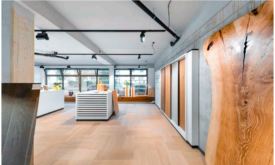
Lichtdurchflutet, modern, großzügig – der neue Showroom von Parkett Neubert schafft absolute Wohlfühlatmosfera.

Außergewöhnliche Projekte erfordern außergewöhnlichen Mut – das bewiesen die Parkettprofis von Parkett Neubert aus Esslingen mit dem Neubau eines Wohn- und Geschäftshauses, bei dem sich der Showroom des Parkettgeschäfts auf rund 200 Quadratmeter Fläche im Erdgeschoss befindet. Die drei Etagen darüber wurden zu Wohnungen ausgebaut. Nach nur 15 Monaten Bauzeit wurde das Mammut-Projekt Mitte letzten Jahres bezogen.