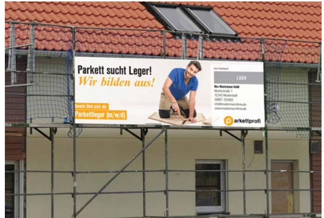
Das Baustellenbanner „Parkett sucht Leger“ können Parkettprofi Mitgliedsbetriebe im Parkettprofi Portal mit Ihrem Firmeneindruck kostengünstig bestellen.

Viele weitere nützliche Tipps und Tools zur Gewinnung neuer Auszubildender erhalten alle Parkettleger-Unternehmen auf der Website der Ausbildungsinitiative Das ist Bodenhandwerk www.das-ist-bodenhandwerk.de !