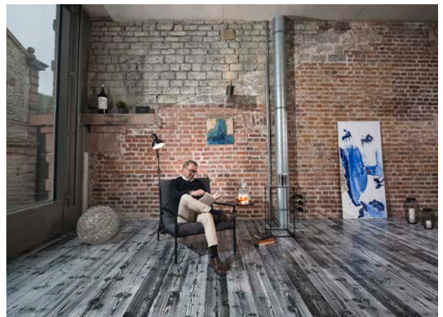
Seriös und zeitlos: Auf diesem Parkettfußboden kamen die Farben schwarz und weiß der PALLMANN FREESTYLE COLLECTION zum Einsatz.

Und wie bei allen Schulungen von Parkettprofi werden neben dem technischen Part auch die Themen „Verkaufen“ und „Rechtliche Aspekte“ auf der Agenda stehen. In diesen Teilen der 2-Tages-Schulung geht es darum, Handwerksarbeit und Kreativität richtig in Szene zu setzen, gekonnt zu argumentieren und auch in der Kundenberatung rechtlich sicher zu agieren. Die Referenten und Spezialisten von PALLMANN zeigen, dass die Einsatzmöglichkeiten der neuen Freestyle Collection nahezu grenzenlos sind: Sei es für die eigenen vier Wände, für Ladengeschäfte, Cafés, Bars oder Ateliers - überall wo sich Individualisten selbst verwirklichen wollen, kann die neue Technik für die Gestaltung atemberaubender Parkettoberflächen zum Einsatz kommen.