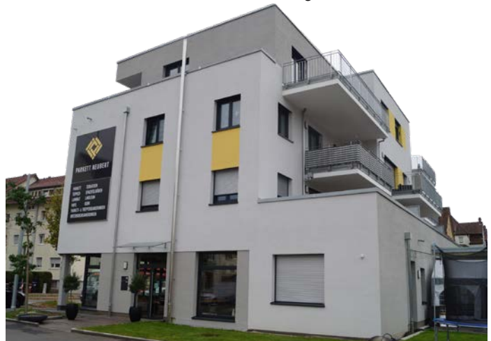
Das neue Wohn- und Geschäftshaus in Esslingen am Neckar.