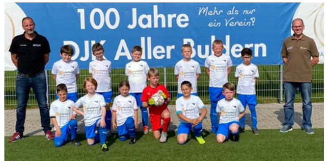
Die Parkettprofis der Brake GmbH & Co.KG in Dülmen haben die Aktion bereits genutzt und den Fußballern der F1 Jugend des DJK Adler Buldern 1919 e.V einen neuen Trikotsatz gesponsert.

Regionale Sportvereine, die wertvolle Jugend- und Sozialarbeit leisten, haben durch die Pandemie das Problem, dass sie Mitglieder verlieren und dass ihnen durch den Wegfall von Turnieren und Veranstaltungen weniger finanzielle Mittel zur Verfügung stehen. Deshalb bietet Parkettprofi unter dem Motto „1.000 Trikots für Deutschland“ seinen Mitgliedern jetzt die Möglichkeit, regionale Vereine mit Trikot-Sets für Kinder- und Jugendmannschaften zu unterstützen. „Wir haben dafür mit einem Sport-Ausstatter einen Rahmenvertrag mit günstigen Konditionen abgeschlossen und der Parkettprofi-Betrieb kann ab sofort bei uns Trikots mit seinem Logo und mit dem Logo des Vereins bestellen. Die Parkettprofis profitieren vom Sonderpreis, den wir aufgrund der großen Menge erhalten. Außerdem wird PALLMANN die Parkettprofi-Mitglieder zusätzlich mit einer Gutschrift von 200,- Euro auf ihrem Guthabenkonto im Parkettprofi Portal unterstützen. Jeder Parkettprofi, der Interesse an einem Trikot-Set für seinen Sportverein vor Ort hat, erhält von uns also ein fertiges Sponsoring-