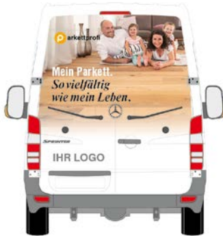
Beispiel für eine Layout-Variante der Fahrzeug Vollbeklebung