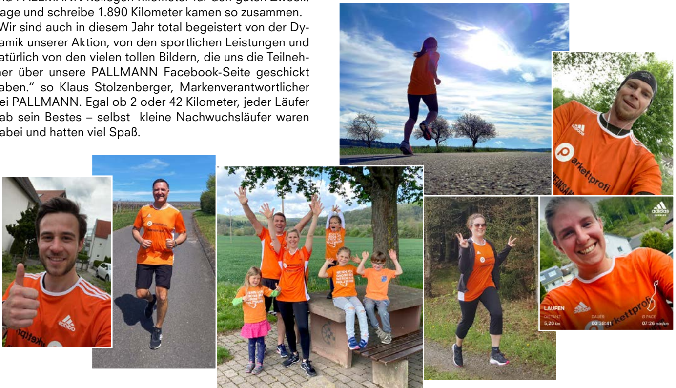
Jeder Teilnehmer des Parkettprofi-Laufteams 2021 lief für sich - regional bei sich zu Hause - war aber unter dem Motto „Gemeinsam läuft's“ dennoch Teil eines großen Teams.

Die PALLMANN GmbH spendet auch in diesem Jahr wieder pro gelaufenem Kilometer einen Euro an die Station Regenbogen (Elterninitiative leukämie- und tumorkranker Kinder Würzburg e.V.).