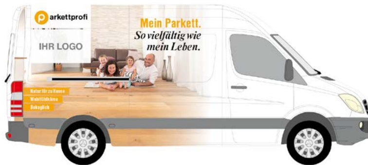
Beispiel für eine Layout-Variante der Fahrzeug-Teilbeklebung.