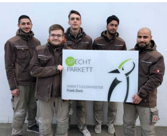
Die Azubis von Specht Parkett sind stolz auf ihren Ausbildungsbetrieb. (Bild aus dem Jahr 2019)